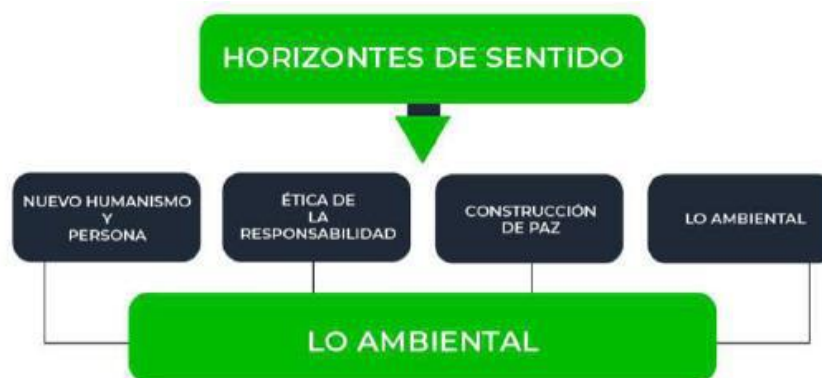
Ilustración 4 Articulación horizontes de sentido con Estrategia 3

La Estrategia 3. Lo Ambiental, articula cuatro horizontes de sentido, como se presenta a continuación: