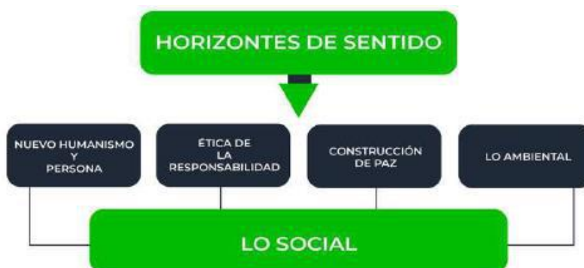
Ilustración 3 Articulación horizontes de sentido con Estrategia 2