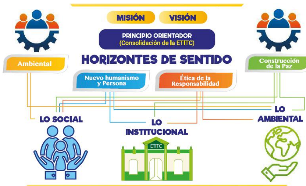
Ilustración 1 Arquitectura estratégica del PDI 2021-2024

Dicho plan se estructuró a partir de la misión, visión, y cuatro (4) horizontes de sentido, a continuación, se ilustra la arquitectura estratégica del PDI 2021-2024 :