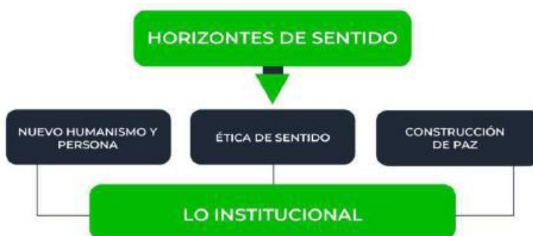
Ilustración 2 Articulación horizontes de sentido con Estrategia 1

La Estrategia 1. Lo Institucional, articula tres horizontes de sentido, como se presenta a continuación: