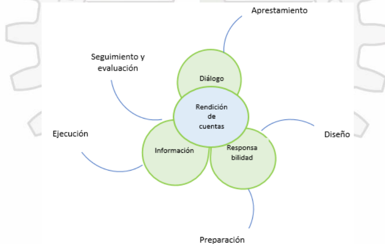
Ilustración 2: Elementos de la rendición de cuentas.

Responsabilidad: Se busca planear acciones que contribuyan a la interiorización de la cultura de rendición de cuentas en los servidores públicos y en los ciudadanos mediante la capacitación, el acompañamiento y el reconocimiento de experiencias.