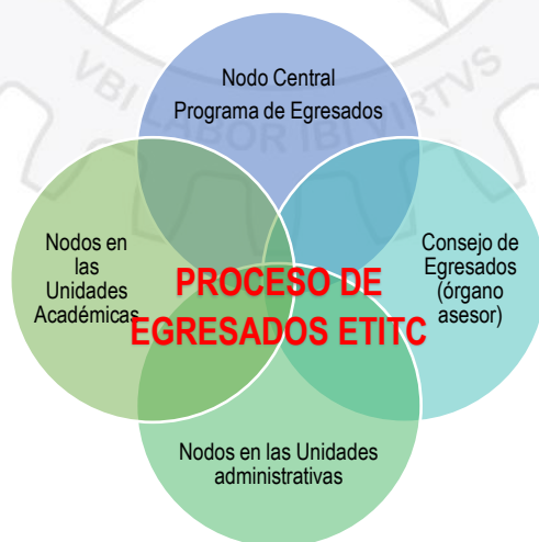
Ilustración 1. Estructura administrativa del Nodo Central, Programa de Egresados.

Que, en esta nueva fase de trabajo UPN realizará el acompañamiento y seguimiento para ejecución de la propuesta de fortalecimiento del Programa de Egresados que comprendería un diseño de la ruta de ejecución, el acompañamiento para que el equipo del Programa de Egresados implemente lo allí planteado en particular las líneas estratégicas, el seguimiento a los desarrollos y la producción de un informe que dé cuenta de la implementación y las recomendaciones de mejora. El centro de esta organización es el proceso de egresados que se convierte en el eje articulador liderado por el Programa de Egresados como Nodo Central, en trabajo colaborativo con los Nodos de las Unidades Académicas y Administrativas y apoyado por el Consejo de Egresados como Nodo asesor que se sugiere configurar. Los nodos propuestos para ser dinamizados son: